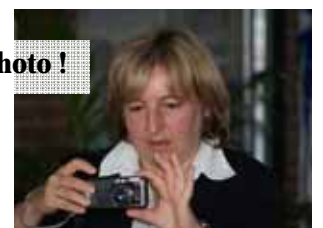
Tout ça mérite bien une photo !