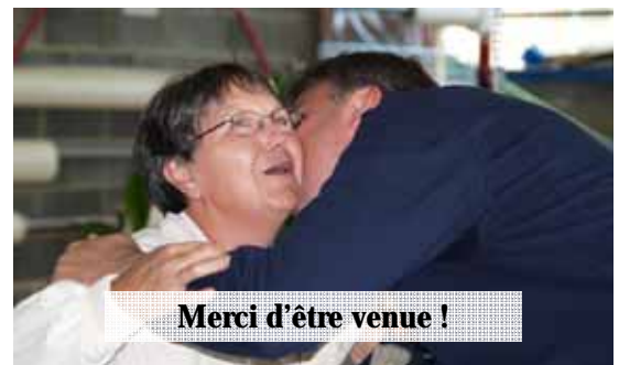
Merci d'être venue !