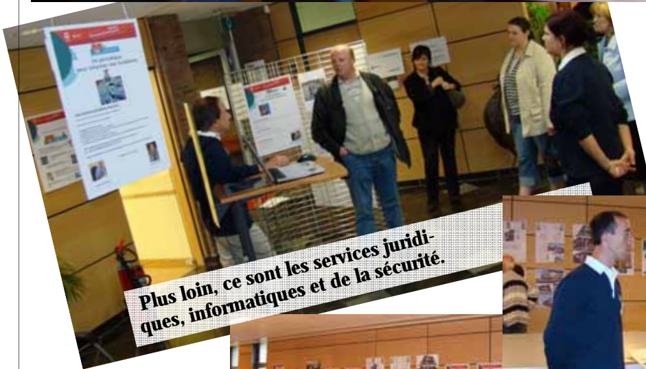
Plus loin, ce sont les services juridiques, informatiques et de la sécurité.