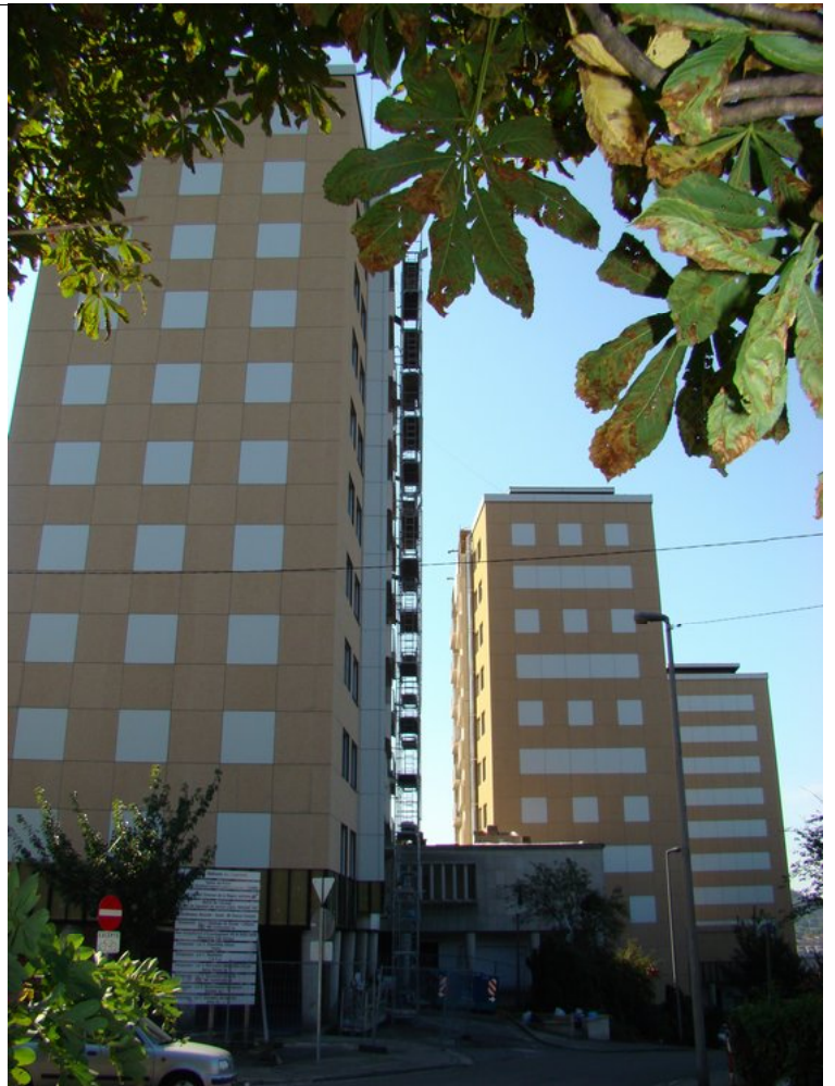
Une jolie variation sur les trois pignons